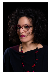
LAURA DOMINGUEZ Conception éclairages