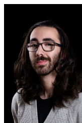
NICOLAS JALBERT Conception sonore